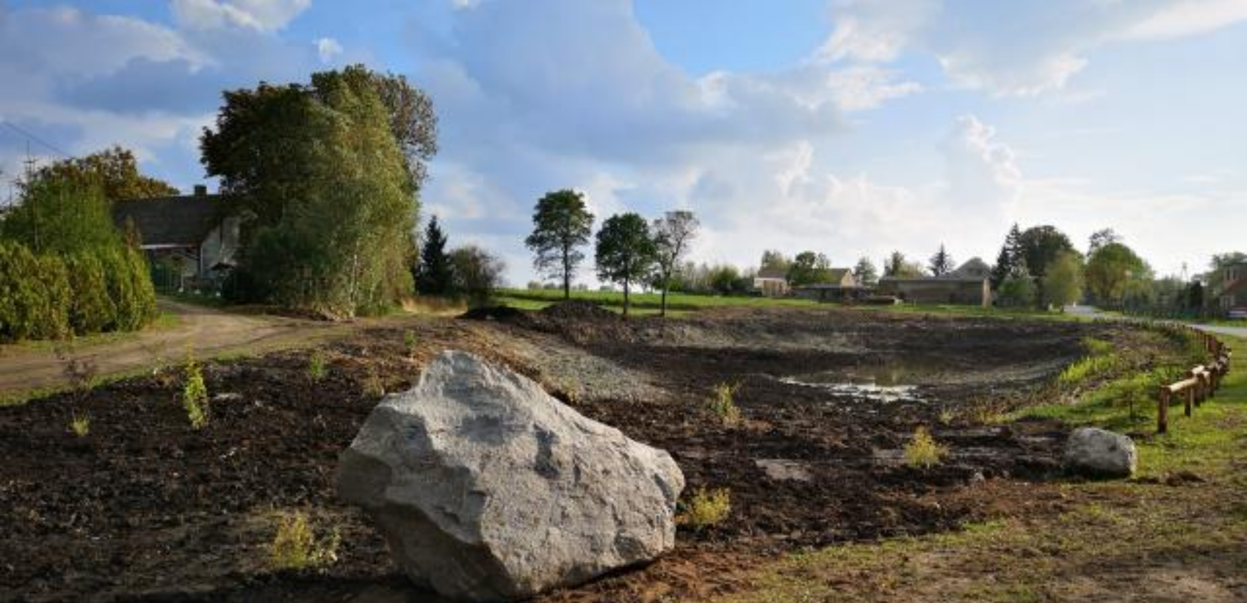
Bajkowy staw w Drzonowie