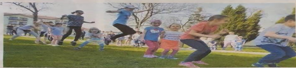
W lisewskim ogródku jordanowskim organizowane są spotkania i festyny rodzinne. W najbliższych miesiącach zmieni się nie do poznania

– Wyzначyliśmy sobie najważniejsze wyzwania, z którymi chcemy się zmie-