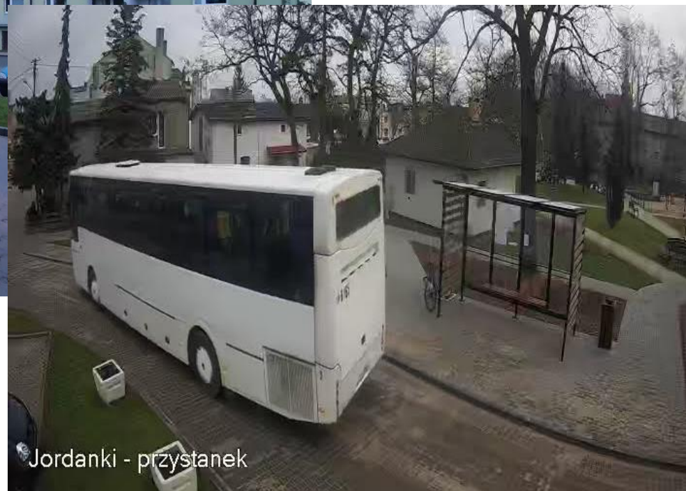
Jordanki - przystanek