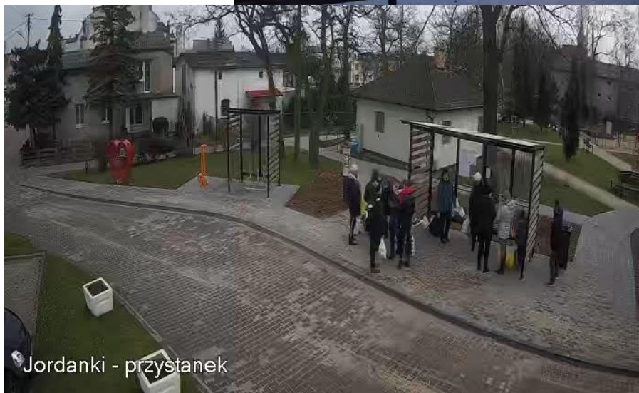
Jordanki - przystanek